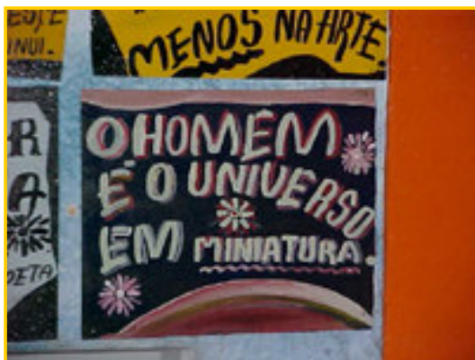
Exemplo de placas expostas em 'Arte Tipográfica de Seu Juca'

Estiveram expostas na Galeria Capibaribe do Centro de Artes e Comunicação da Universidade Federal de Pernambuco durante todo o congresso 100 placas de autoria do artista, e 6 monografias sobre design vernacular, de conclusão do curso de Design da UFPE: