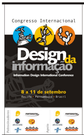
Banner | Patrocínio/Apoio